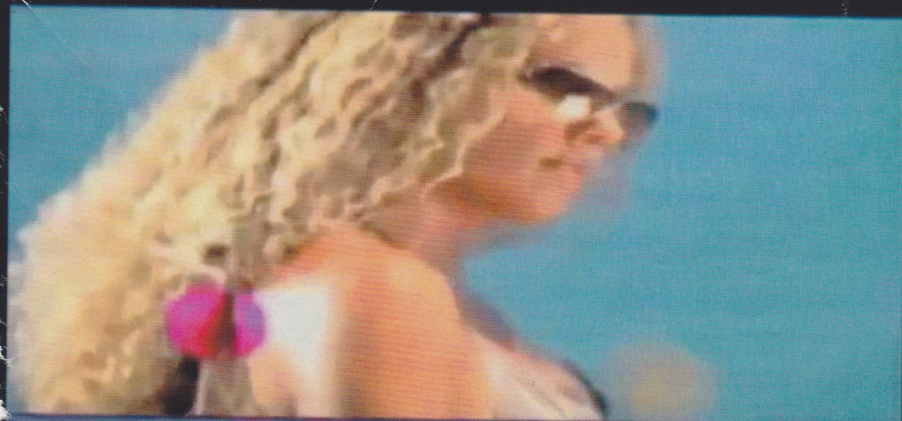
la sfigada esta pe' strada