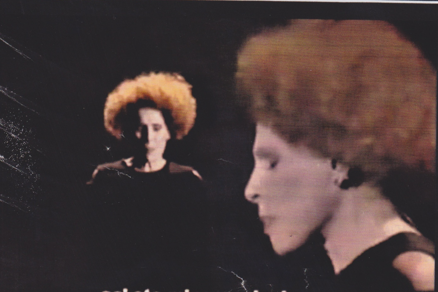
co' ste minorenni adesso

NELLE TRE FOTO, ALTRETTANTI MOMENTI DEI VIDEO SATIRICI CHE LA SORA CESIRA HA DEDICATO AL «CASO RUBY» E A SILVIO BERLUSCONI. IN ALTO, MANNAGGIAMMÈ CHE FA IL VERSO AL CELEBRE TORMENTONE MUSICALE ASEREJE . AL CENTRO ARCORE'S NIGHTS , PARODIA DI UNO DEI BRANI PIÙ NOTI DI GREASE . SOTTO, LA RILETTURA DI COSTRUZIONE DI UN AMORE DI ORNELLA VANONI